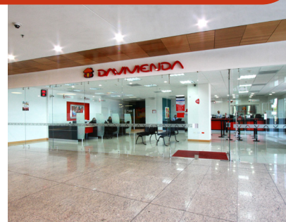
C.C. Bocagrande - Cartagena