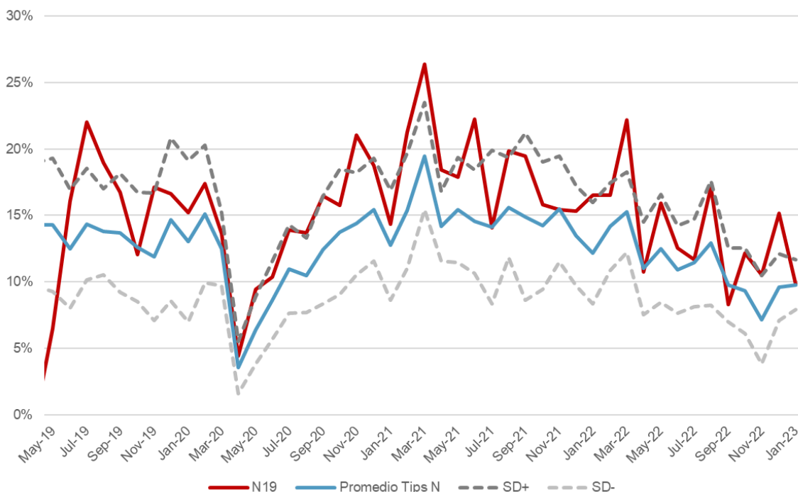
Gráfico 1 Tasa de prepago anualizada promedio de los Tips Pesos N frente a los Tips Pesos N-19 (Junio 2019 – Enero 2023)

En el Gráfico 1 observamos que la transacción ha presentado niveles superiores de prepago al promedio de los Tips Pesos N. En el periodo de junio 2019 a febrero 2023, los Tips N-19 registran un nivel de prepago promedio de 15.46% frente a un 12.66% promedio de los Tips Pesos N. Para el segundo semestre del 2022, el prepago promedio fue de 12.48%, un descenso frente a su registro histórico que consideramos se mantendrá a lo largo de la parte alcista del ciclo de tasas.