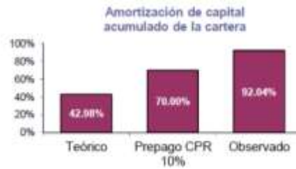
Gráfico No. 3: Amortización de capital acumulada a julio de 2014

Como resultado de los altos niveles de prepago experimentados a lo largo de la emisión, el capital de la emisión de los Tips Pesos E-12 presentó una reducción mayor a la esperada por Titularizadora Colombiana S. A. A julio de 2015, el 92,04% del capital de la cartera se había amortizado frente a una amortización calculada de 42.98%, usando un nivel de prepago de referencia de 10% (ver Gráfico No. 3).